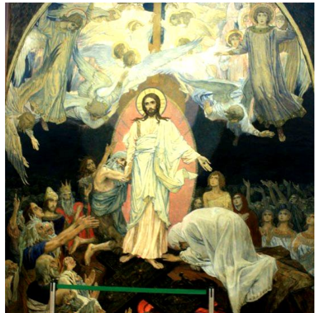
Сошествие во ад.