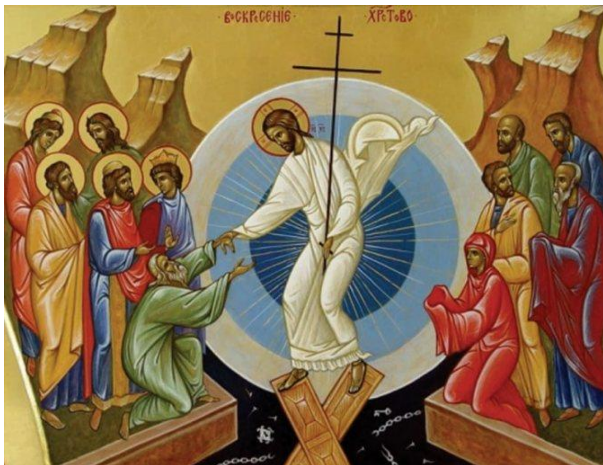
Икона «Воскресение Христово»

В этот день празднуется воскресение Иисуса Христа и проповедуется наше общее воскресение, которое тоже будет.