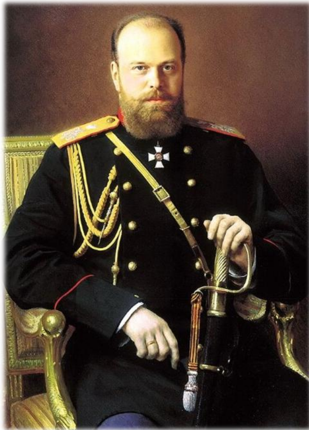
(Император Александр III)

«У России нет друзей. Нашей огромности боятся... Самодержавие сделало историческую индивидуальность России. Во всем свете у нас два надежных друга - русская армия и русский флот»