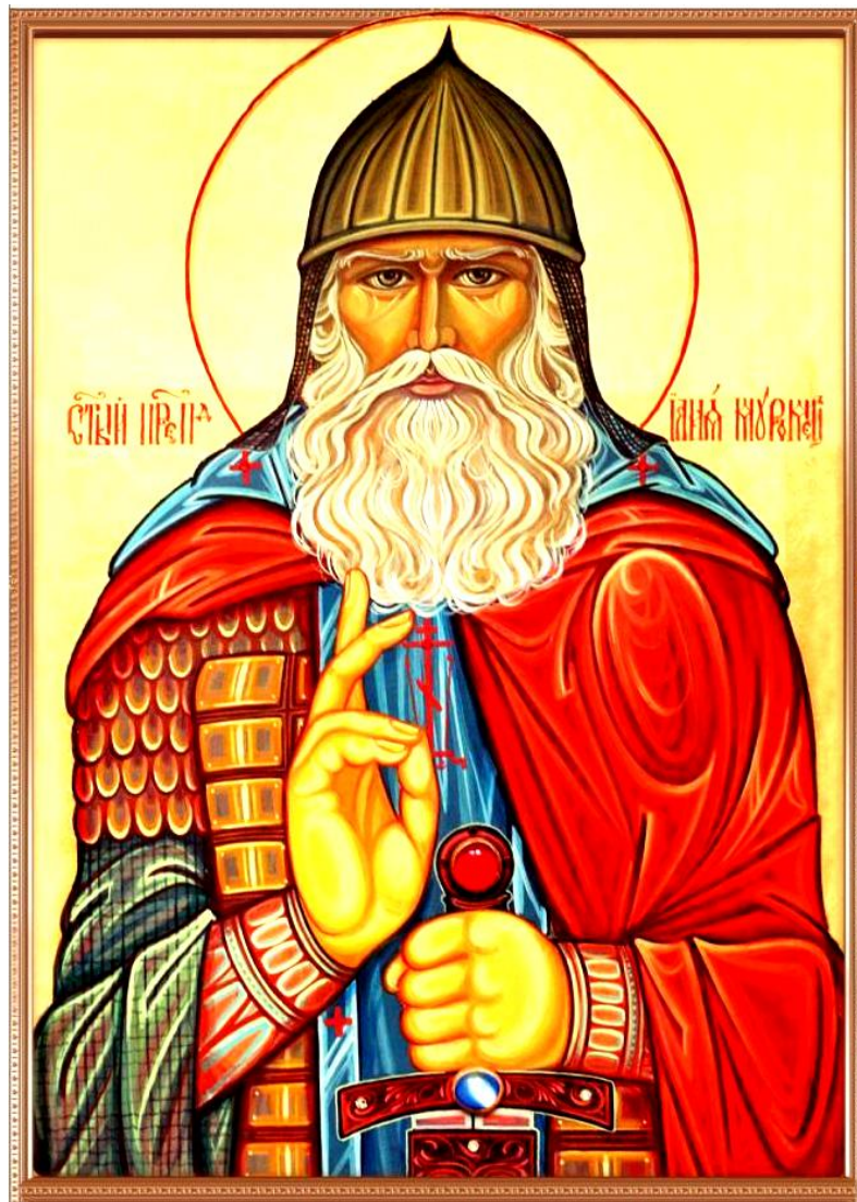
Святой праведный ИЛЬЯ МУРОМЕЦ (День памяти Преподобного Ильи из Мурома 1 января )