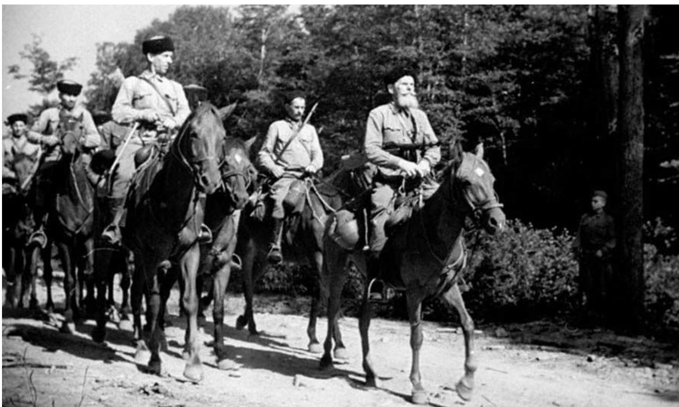
Казаки 4-го гв. кавалерийского корпуса на марше, 1942 год

В декабре 1942 года, в связи с неудачами под Сталинградом, с кавказского фронта также были сняты и некоторые немецкие соединения, в результате чего немецкая группировка на Кавказе ещё больше ослабла, и к началу 1943 года стала уступать советским войскам в численности – как в личном составе, так и в технике и вооружении.