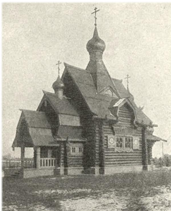
Храм «Утоли моя печали» в Царском селе. 1915 год