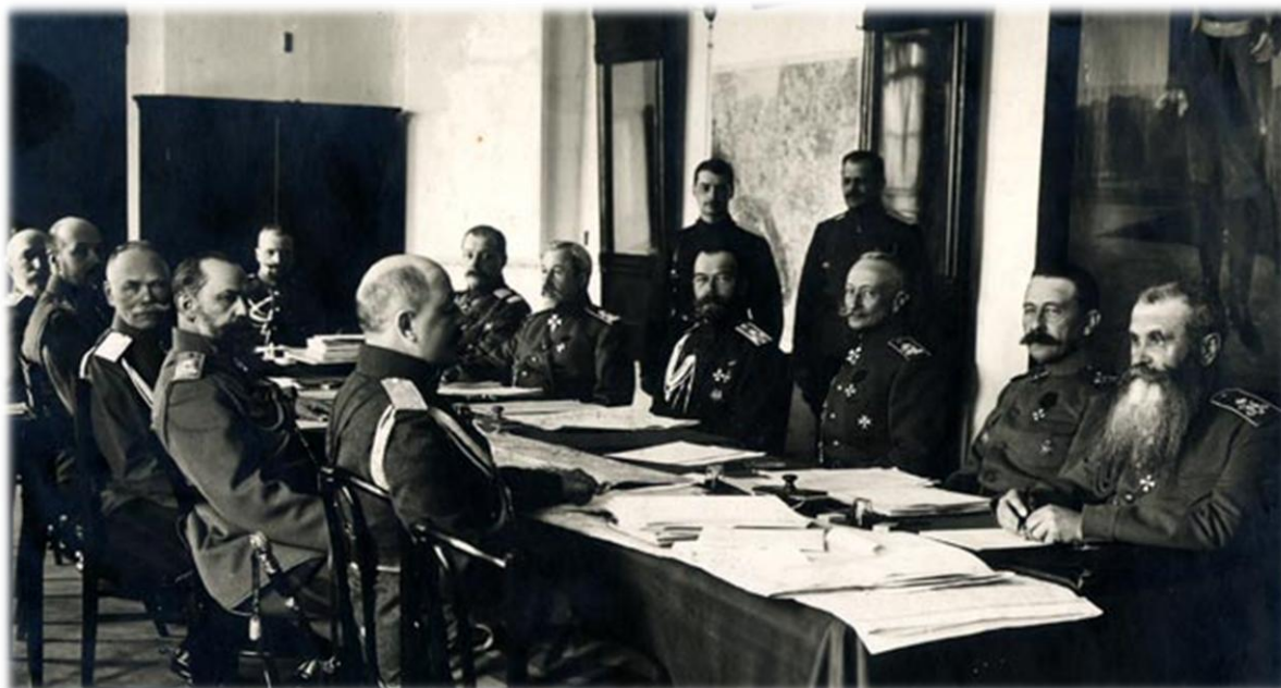
Николай II и командующие фронтами на заседании Ставки

Первыми шагами Императора на посту Верховного Главнокомандующего была смена руководства Ставки - устранен весь предыдущий высший командный состав. Определены в структуре Ставки управления артиллерийское, инженерное, воздухоплавательное, интендантское, походного атамана казачьих войск и протопресвитера военного и морского духовенства.