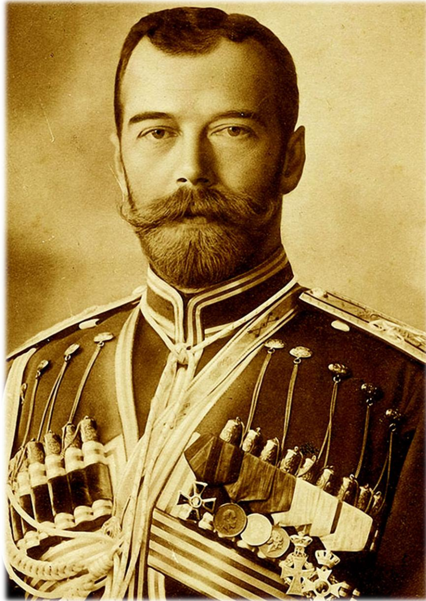
ГОСУДАРЬ ИМПЕРАТОР НИКОЛАЙ-II (18.05.1868-17.07.1918)

«Самым трудным и самым забытым подвигом Императора Николая II было то, что он, при невероятно тяжелых условиях довел Россию до порога победы: его противники не дали ей переступить через этот порог»