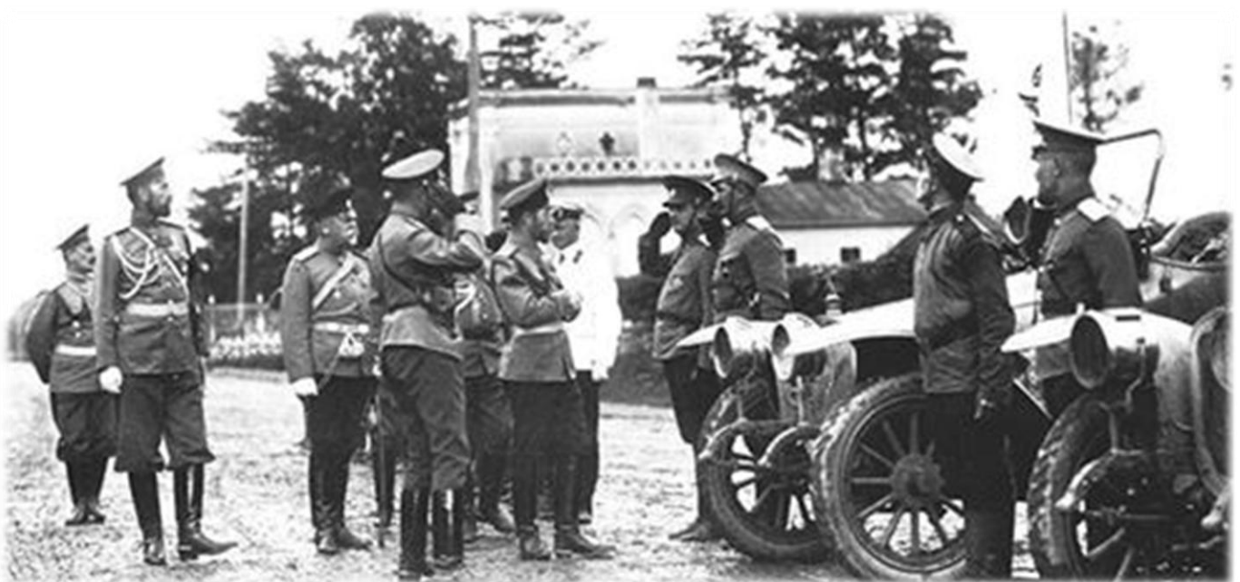
Император и сопровождающие его лица В районе боевых действий .1916 год

Четкое и конкретное руководство войсками со стороны Николая II, привели к слаженности деятельности Ставки и сыграли важнейшую роль в успешном окончании Вильно-Молодечненской операции 19 сентября. Несмотря на огромные усилия, предпринимаемые немцами, им не удалось уничтожить русскую 10-ю армию. 10-я германская армия была отражена по всему фронту и начала быстрый отход. Войскам снова вернулась уверенность в способности бить врага.