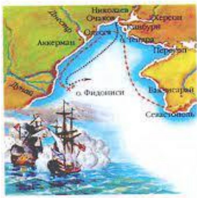
Сражение у острова Фидониси.