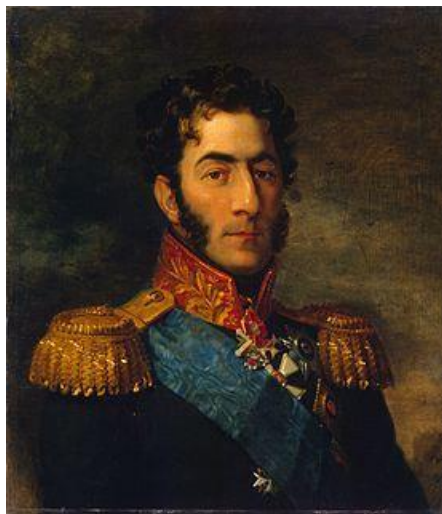
Багратион Петр Иванович