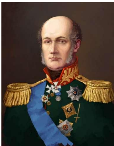
Барклай-де-Толи Михаил Богданович