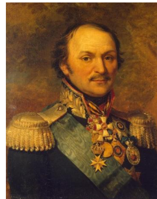
Платов Матвей Иванович