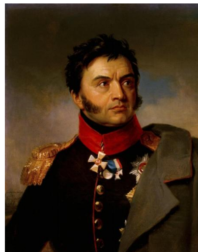
Раевский Николай Николаевич