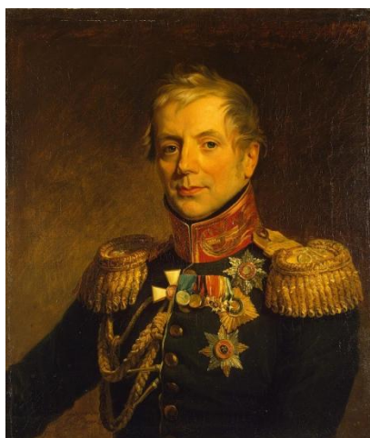
Коновницын Петр Петрович