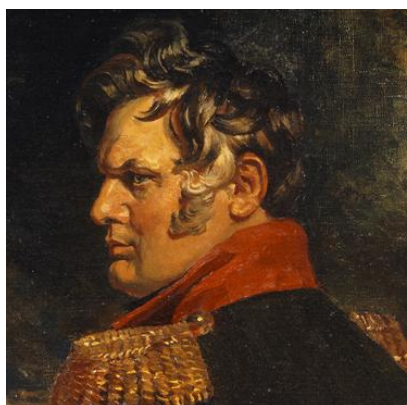
Ермолов Алексей Петрович